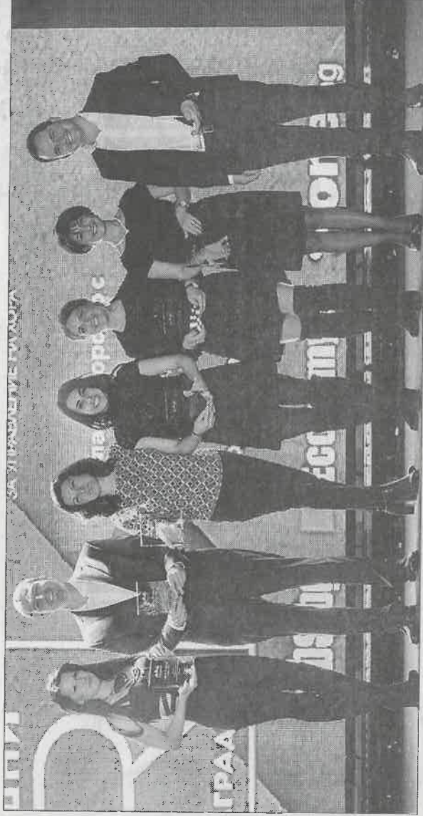
През миналата седмица бяха раздадени наградите за най-добри специалисти по управление на човешките ресурси. Победителите се състезаваха в седем категории, имаше и две специални награди.